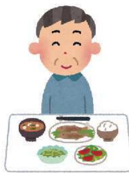
食事はバランスよく