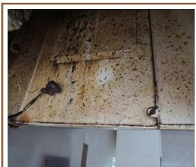
もういちどシュシュッと、