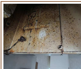
ぞうきんでこすると・・・