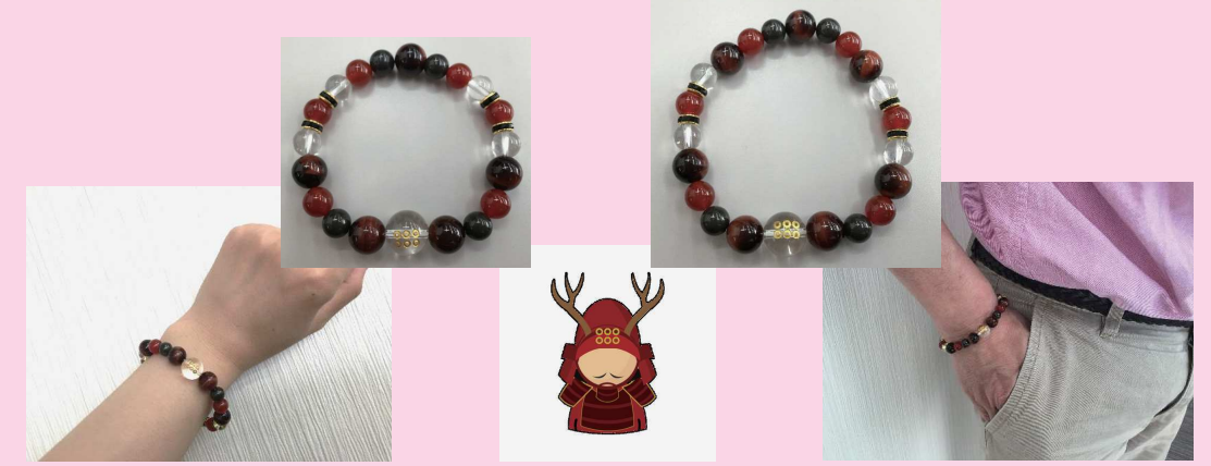
女性用サイズ15cm(内径) 価格¥2,900(税込) 男性用サイズ17cm(内径) 価格¥3,900(税込) ※オベロンゴム使用。ご希望のサイズに調整いたします

4月の誕生石・・・水晶 産地・・・ブラジル、マダガスカル、その他 宝石言葉・・・会心・純粋・純真・繁栄・万物の調和 効果・・・良い方向へと流れを変え、生命力を高め、体力を増強し、やる気、集中力、洞察力や決断力、創造力を高め、持ち主の能力を引き出します。何となく気だるい気分が陥ってしまった時、絶対に失敗できない大切な時などに力になってくれる。また、他の石の力を引き出すのにも役立つといわれています。