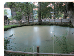
黒山椒魚の産卵地