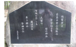
出口王仁三郎の和歌

皆神山には、熊野出速雄神社や御神木のヒムロビヤクシン、富士浅間神社、このはな桜、天満宮、天地カゴメの宮や数多くの石碑など。。。さらには宇宙空間への航行基地として造られたという説があったり。これだけ色々なものがあるという事は、やっぱり皆神山には何かありそうですね。。。調べれば調べる程、不思議な皆神山。おもしろいですね～。まだまだ秘密がありそうな謎の多いところですよ。