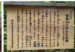
皆神山に伝わる民話